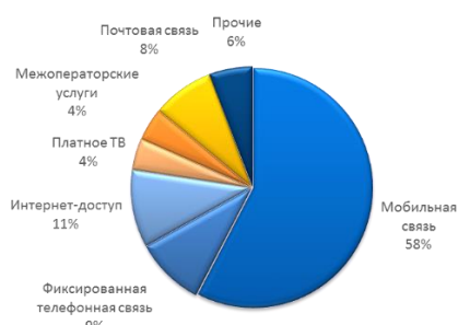
Структура телеком рынка РФ, 2014П